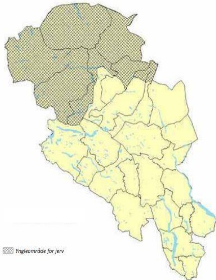
Figur 11: Prioritert jervområde i region 3 (Oppland).