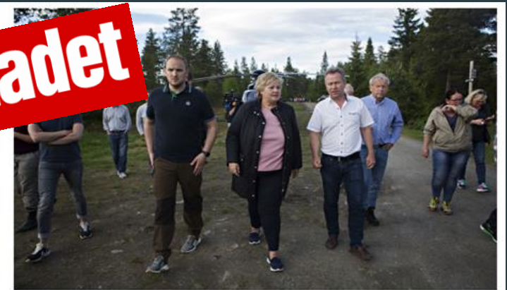
JAKT: Landbruksminister Jon Georg Dale og statsminister Erna Solberg møtte jegere og sauebønder i Gran kommune torsdag kveld. Her blir statsministeren og landbruksministeren tatt imot, etter at Solberg landet i helikopter.