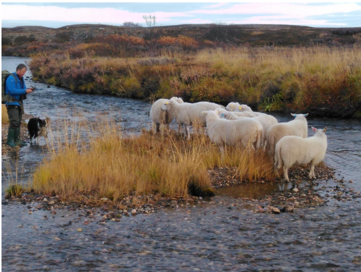
Sauesanking i Komagdalen 2018