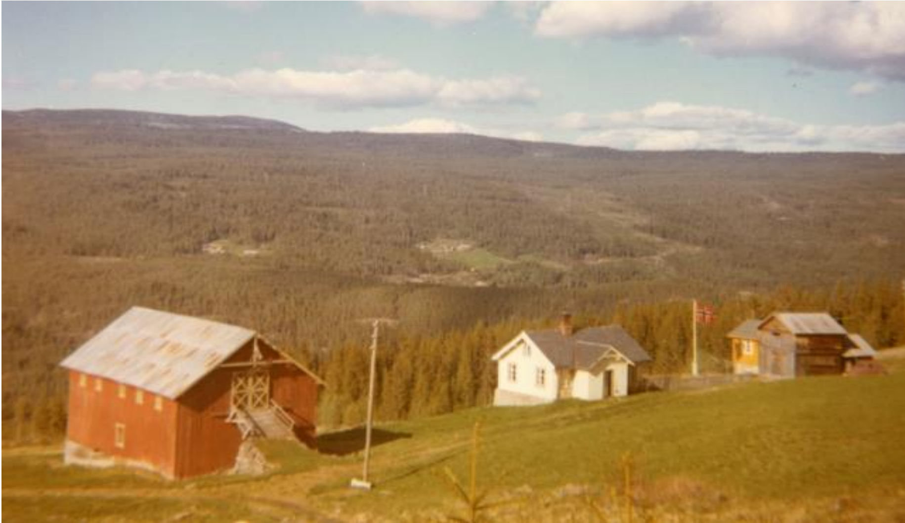
Stuveset - ca. 1960