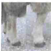
Korte rette haser

Brune/grå farge på dekkhår Føttene ikke så grove Litt lyse på mule og klauver