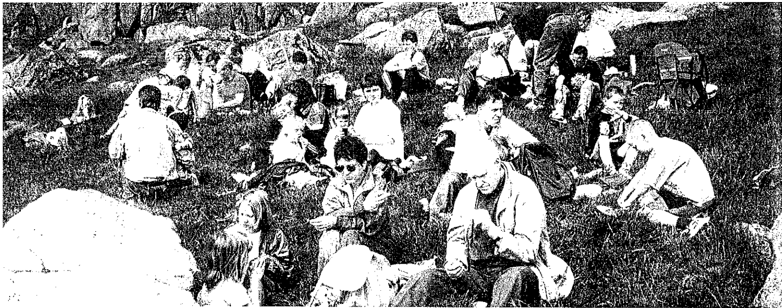
Time Sau- og Geitagslag legg stor vekt på sosiale aktivitetar for medlemmane. Her har laget sommartur til Njåfjellet.

For å styrka miljøet og den faglege satsinga, var laget i første delen av 1980-åra med på bygginga av Time skyttarlag sitt nye anlegg gjennom dugnadsinnsats. Slik har ein fått eit flott møtelokale og fast kåringsplass på skytebaneområdet.