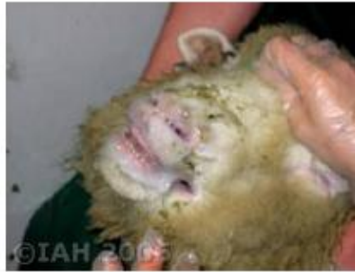
Dorset Poll sheep 6 d.p.i.: severe salivation, respiratory distress