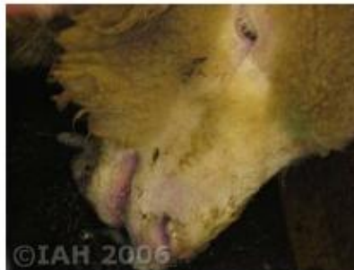
Severe respiratory difficulties, dyspnoea and asphyxia due to froth and oedema in the respiratory system resulting in a cyanotic tongue 6 d.p.i.