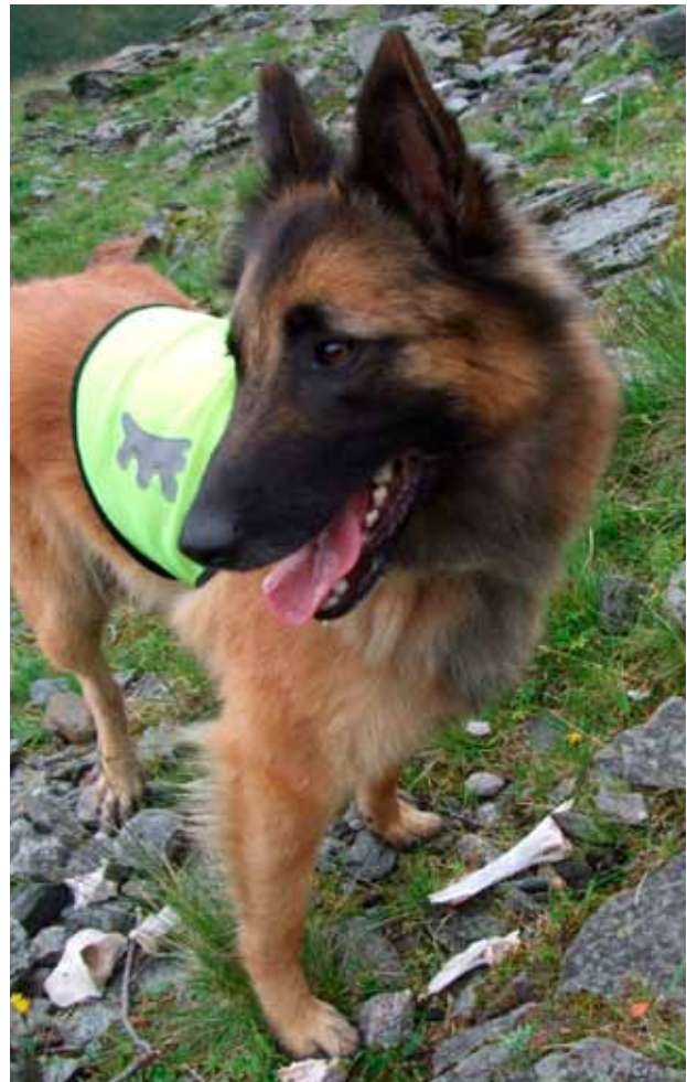
Figur 4. En tervueren har funnet et gammelt sauekadaver. Det er lurt å utstyre hunden med dekken for å markere både for hunden og andre at den er på jobb.

Oppland Gjeterhund Lag har lagt fram forslag om krav til prøve for kadaversøks-ekvipasjer og krav til godkjenning av instruktører ( http://www.nsg.no/referat/kadaversoek-rapport-framdrift-article2205-1321.html ).