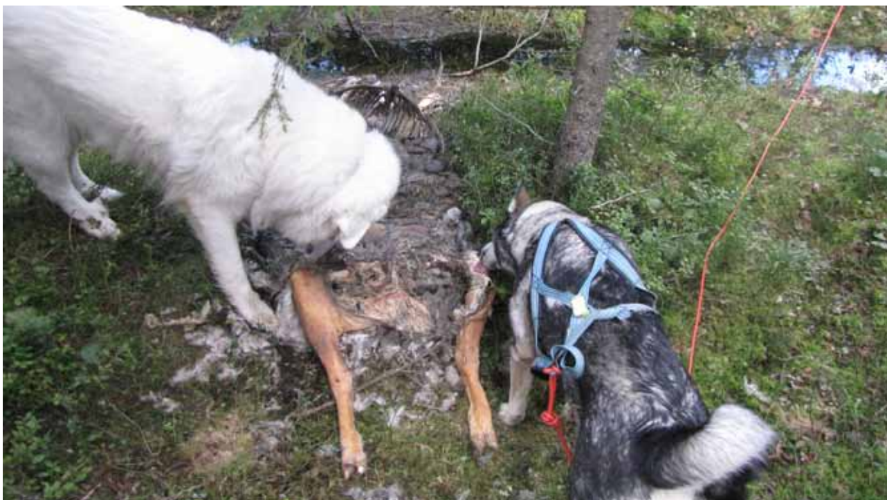
Figur 5. En pyreneerhund og en jämthund med nese for kadaver. Et mål er å finne kadaveret så ferskt som mulig, slik at dødsårsak kan dokumenteres.