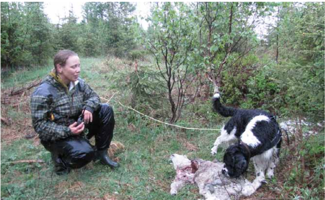
Figur 2. Hunden forstår fort hva dette dreier seg om dersom det roses til rett tid.

Fortsett helst med praktisk kadaverøk i felt i ditt eget eller andres beiteområde gjennom beitesesongen, slik at det blir kontinuitet og progresjon i treninga.