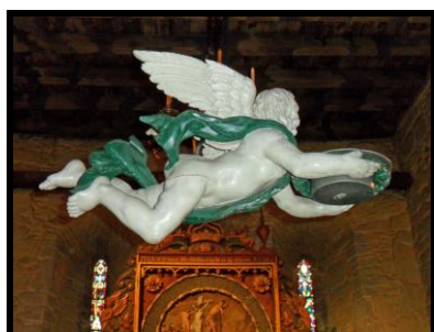
Døpefonten i Vangskyrkja

Voss kyrkje - Vangskyrkja - gjorde inntrykk. Den er bygd i mur, ble oppført i 1277, har 460 sitteplasser og er nå fredet. Det eneste som er igjen av det opprinnelige mellomalderinventaret, er alteret av stein. Prekestolen i gjennomført renessansestil er antakelig fra før 1650, og døpefonten, en engel som senkes ned fra taket, er fra 1820.