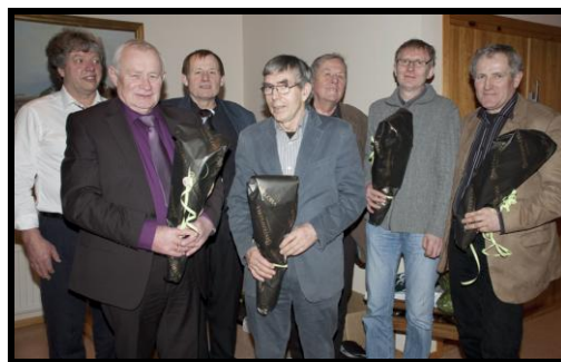
Et knippe tidligere formenn i laget