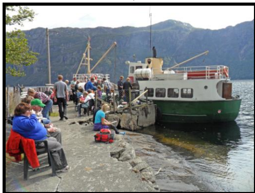
Grilling på kaia ved Dyrskog.

Været var fint, og det ble en flott båttur innover vatnet. Målet var Dyrskog, en av de mange nedlagte og veiløse gårdene langs vatnet. Her tok vi turen opp til tunet, hvor vi kunne nyte den fantastiske utsikten over vatnet og tidligere tiders møysommelige arbeid som ligger bak dagens kulturlandskap i den bratte lia. Nede i havna nedenfor gården grillet vi medbrakte råvarer, før vi igjen gikk om bord og lot oss frakte tilbake til bilene i Odlandstø.