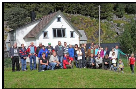
Turdeltakerne samlet foran stua på Dyrskog.