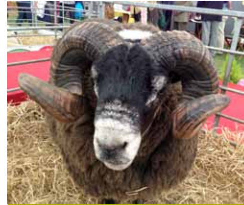
Minne fra turen til Skottland 2013. Praktver på Royal Highland Show 2013.