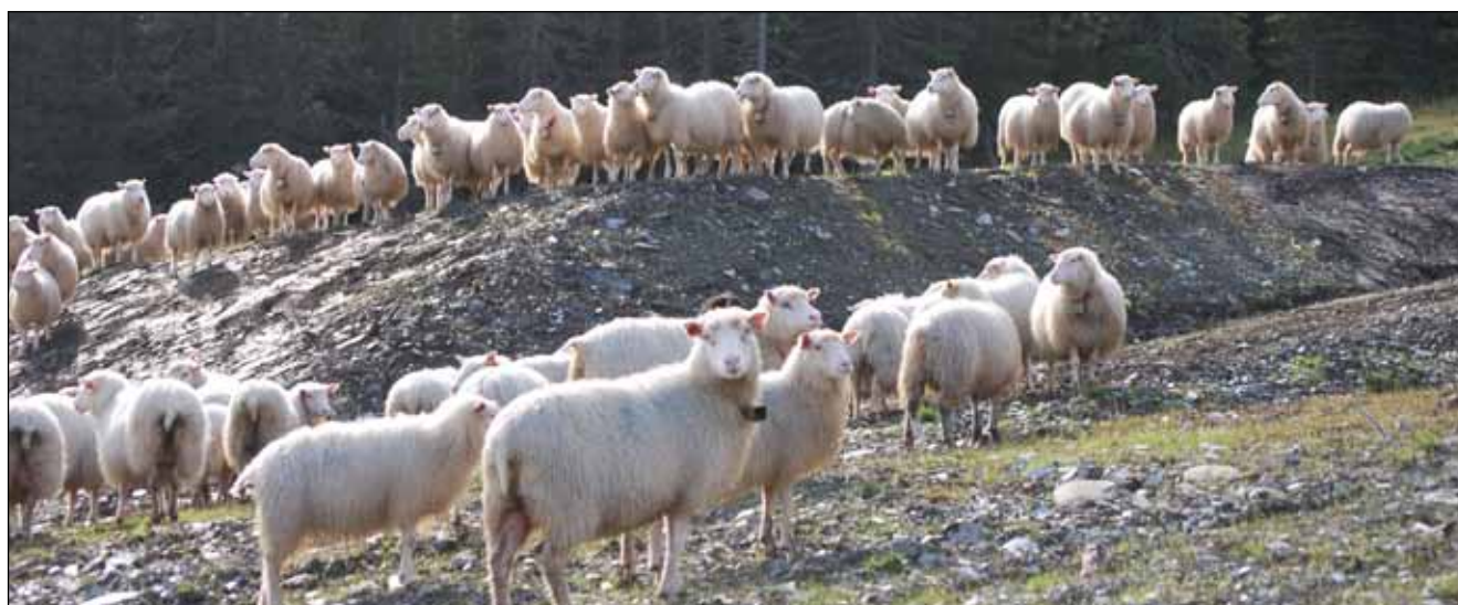
Oppstilling før marsjen hjem