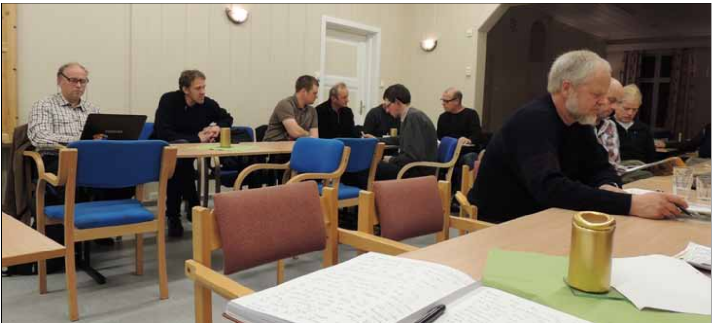
Fra høstmøte i Sør-Fåvang grendehus