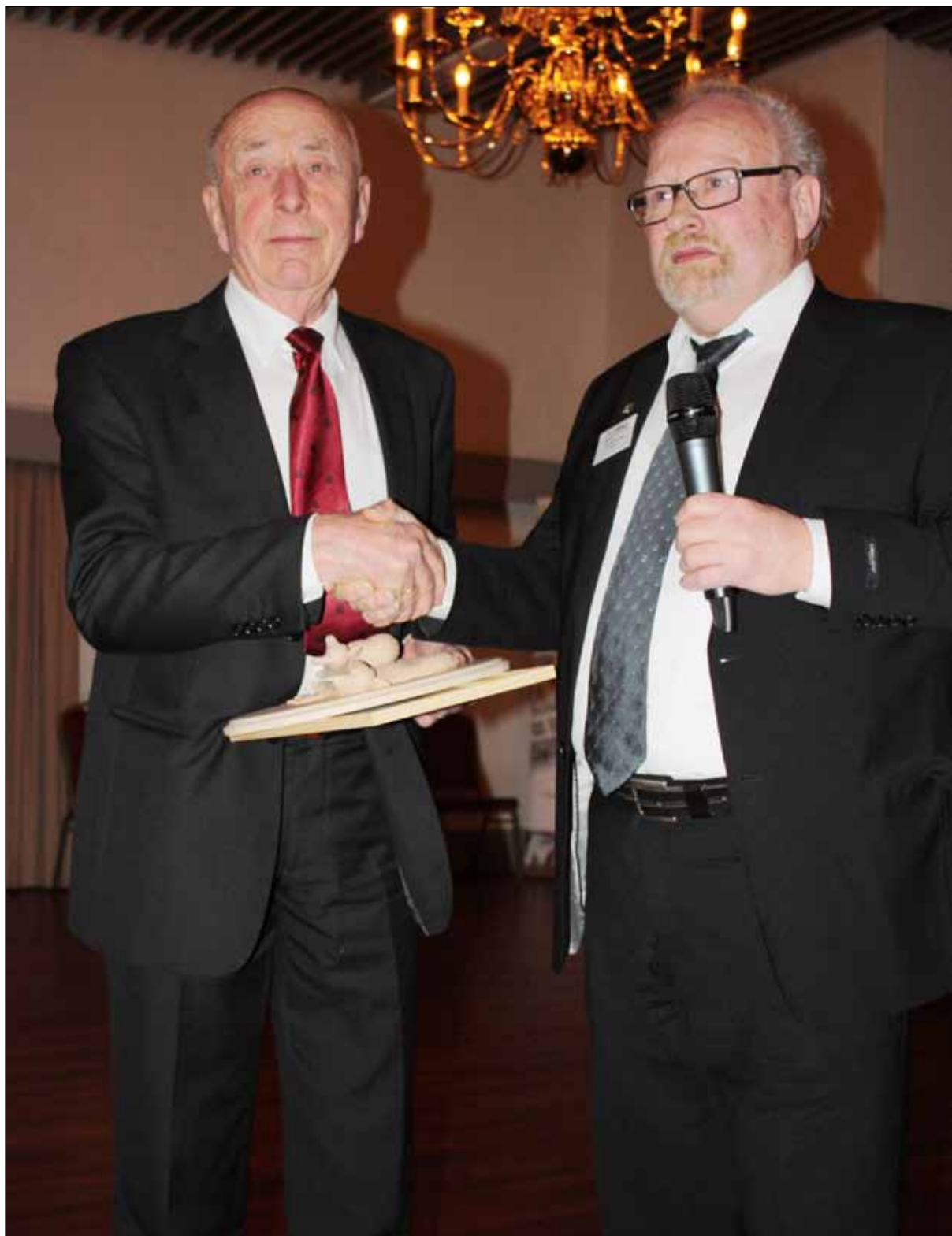
UTDELING AV GROMSÅUPRISEN 2013