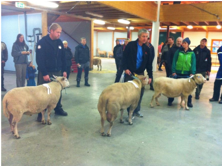
Beste værane på værutstillinga i Seljord hausten 2013