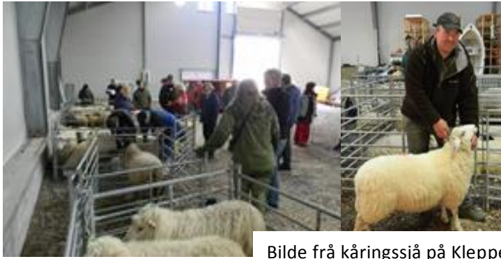
Bilde frå kåringssjå på Kleppen i Sauland