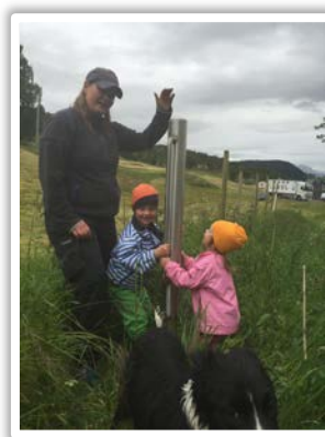
Sammen er vi sterkere

Gruppen fikk selv ansvar for å diskutere seg frem til hvordan de best mulig kan skape en god lagånd i gruppa. De måtte og finne ut hvordan de i størst mulig grad får mest ut av treningen ilag.